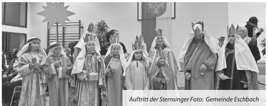
Auftritt der Sternsinger