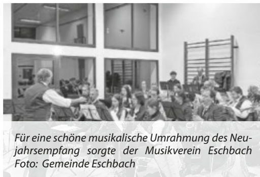
Für eine schöne musikalische Umrahmung des Neujahrsempfangs sorgte der Musikverein Eschbach